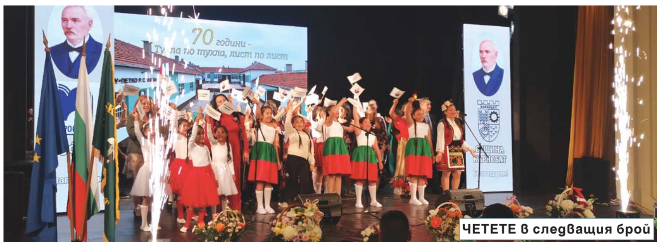
ЧЕТЕТЕ в следващия брой

Мажоретният състав се включи в кампанията на Общината "Засади дръвче на твоето място..."